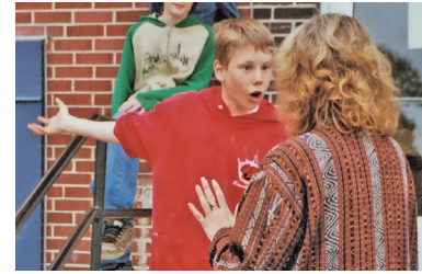
Mise en scène