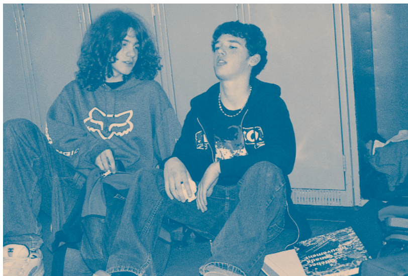
Des jeunes du profil art de la scène de la Polyvalente de Charlesbourg ont bien voulu se prêter à cette mise en scène.

Au plan familial, les garçons semblent être influencés plus négativement par les facteurs socioéconomiques (Alexander et al. , 1997), le manque de cohésion, les conflits, le manque de support affectif dans la famille, le faible engagement, l'encadrement et la discipline ambivalente alors que les filles sont plus sensibles au manque de cohésion et d'organisation dans la famille, au faible engagement,